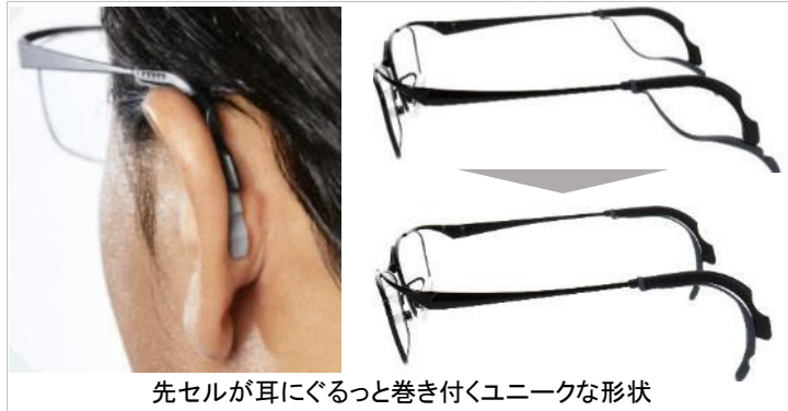
先セルが耳にぐるっと巻き付くユニークな形状

耳に吸い付くようにしっかりとフィットするので、走ったり、飛び跳ねたりと激しく動いても、汗をかいても、ずり落ちません。