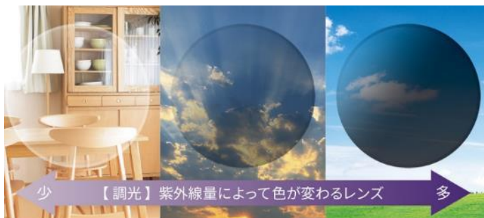
紫外線とまぶしさ対策に、掛けかえ不要で便利! 紫外線100%カット!

調光タイプのレンズは、天候や時間帯による掛け替えが不要なので、まさに 1 本で 2 本分の役割を持ちます。また紫外線カット機能も搭載しています。運動している際の“まぶしさ対策”となり、体力の消耗を防いだり、集中力をキープすることが期待できます。